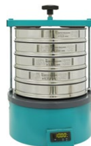
Анализатор A 30 на базе ВП 30Т