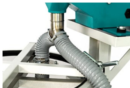
Грохот ГР 50 удвоенной производительности с одновременной загрузкой на 2 сита