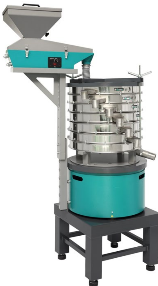
Агрегат рассеивающий на базе ГР 50 с Питателем ПГ 1