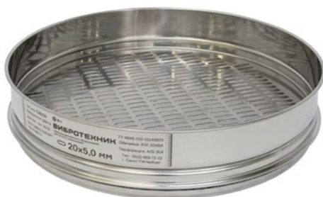
Сито с продолговатыми отверстиями С 30/50