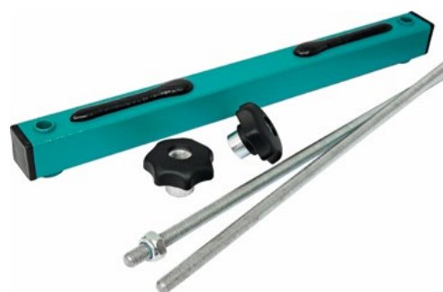
Устройство крепления сит УКС