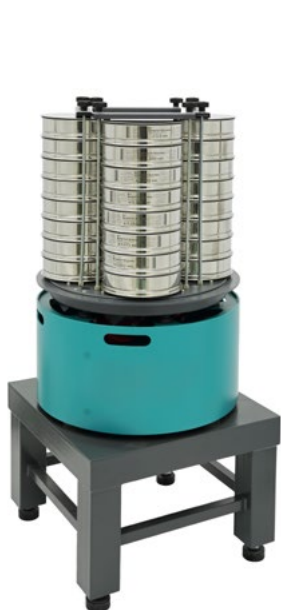
Анализатор A 20x4 на базе ВП 50 на Тумбе Т 40