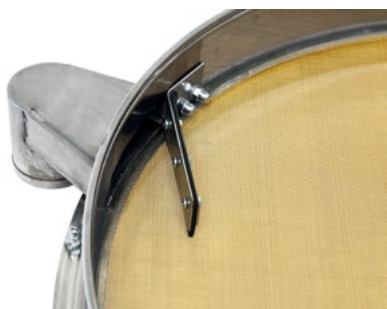
Патрубок и отбойник сита ГР 50