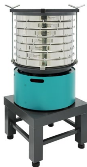
Анализатор A 50 на базе ВП 50 на Тумбе Т 40