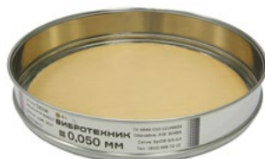
Сито С 20/38 с сеткой из бронзы