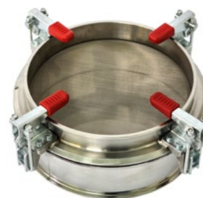
Сито С 20P с полиамидной сеткой на поддоне Ø200 мм