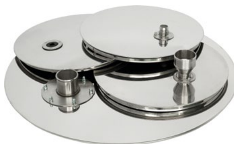
Крышки ГР 30 с патрубком и мембраной, Крышка ГР 50 с воронкой