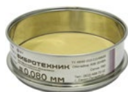
Сито С 12/38 с сеткой из латуни