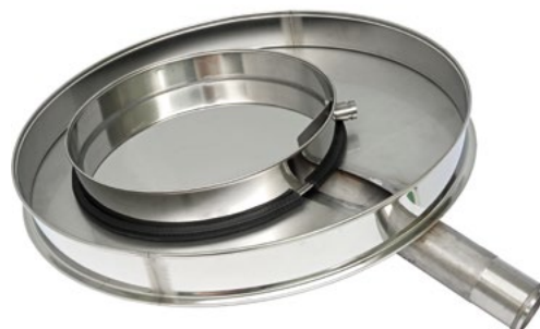
Поддоны Грохота ГР 30 и ГР 50