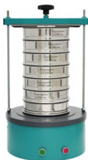
Анализатор A 20 на базе ВП 30