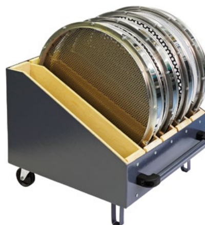
Кассета С 50