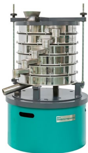
Грохот ГР 40