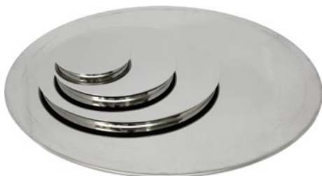
Крышки диаметром 120, 200, 300 и 500 мм