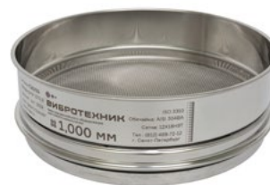
Сито контрольной точности С 20/50 с сеткой из нержавеющей стали