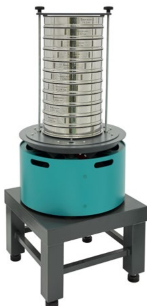
Анализатор A 30 на базе ВП 50 на Тумбе Т 40