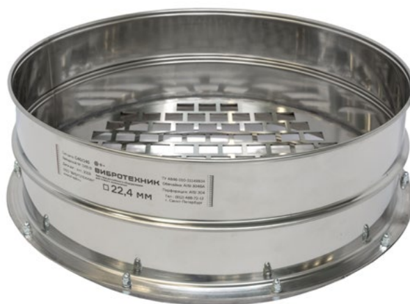
Сито С 40/140 с квадратной перфорацией