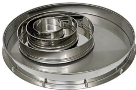
Поддоны диаметром 120, 200, 300 и 500 мм

Поддон грохота предназначен для непрерывной разгрузки в приемную емкость материала, прошедшего через нижнее сито.