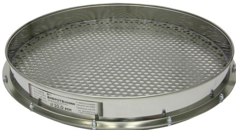
Сито С 50/70 с круглой перфорацией