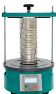
Анализатор A 12 на базе ВПС