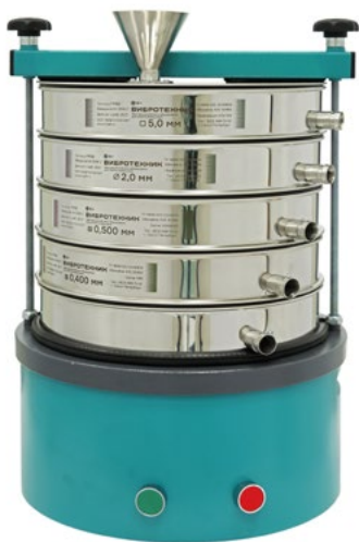
Грохот ГР 30