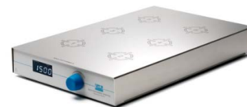
Multistirrer Digital 6 Расстояние между центрами позиций 100 мм