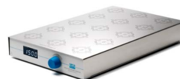
Multistirrer Digital 15 Расстояние между центрами позиций 74 мм

Габариты 230 x 370 x 51,5 мм. Масса 1,75 кг / 2,1 кг.